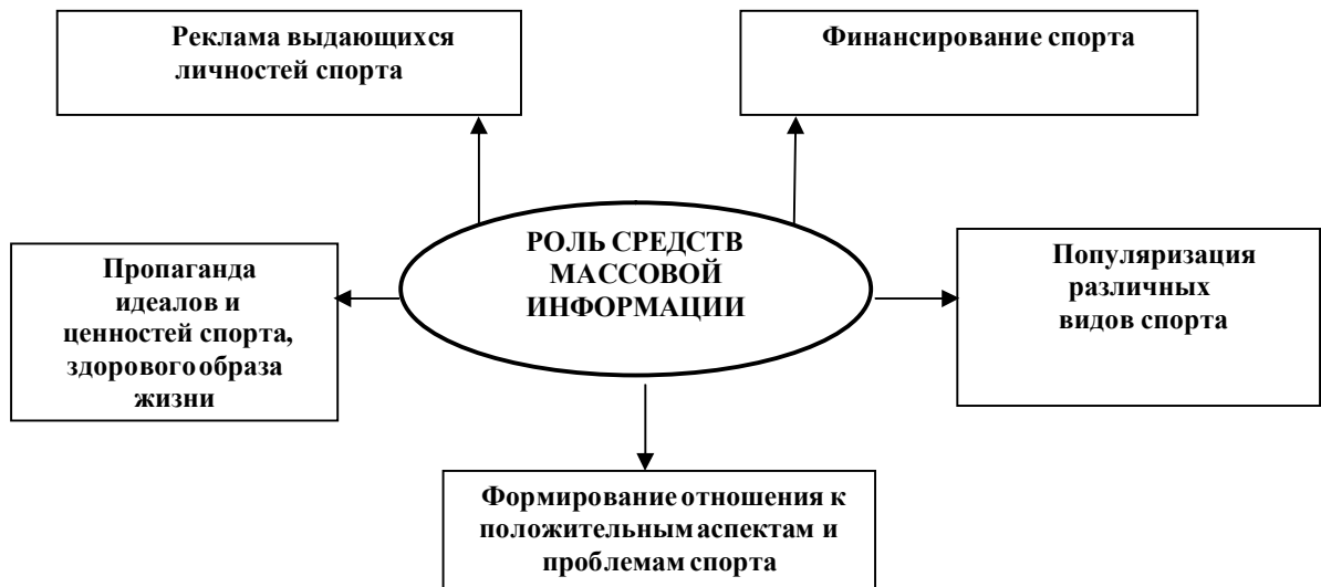
Рис. 1. Роль средств массовой информации в развитии спорта

Таким образом, роль СМИ в современном мире – огромна, и проявляется практически во всех сферах деятельности человека, в том числе и в спорте [3, 4] (рис. 1).